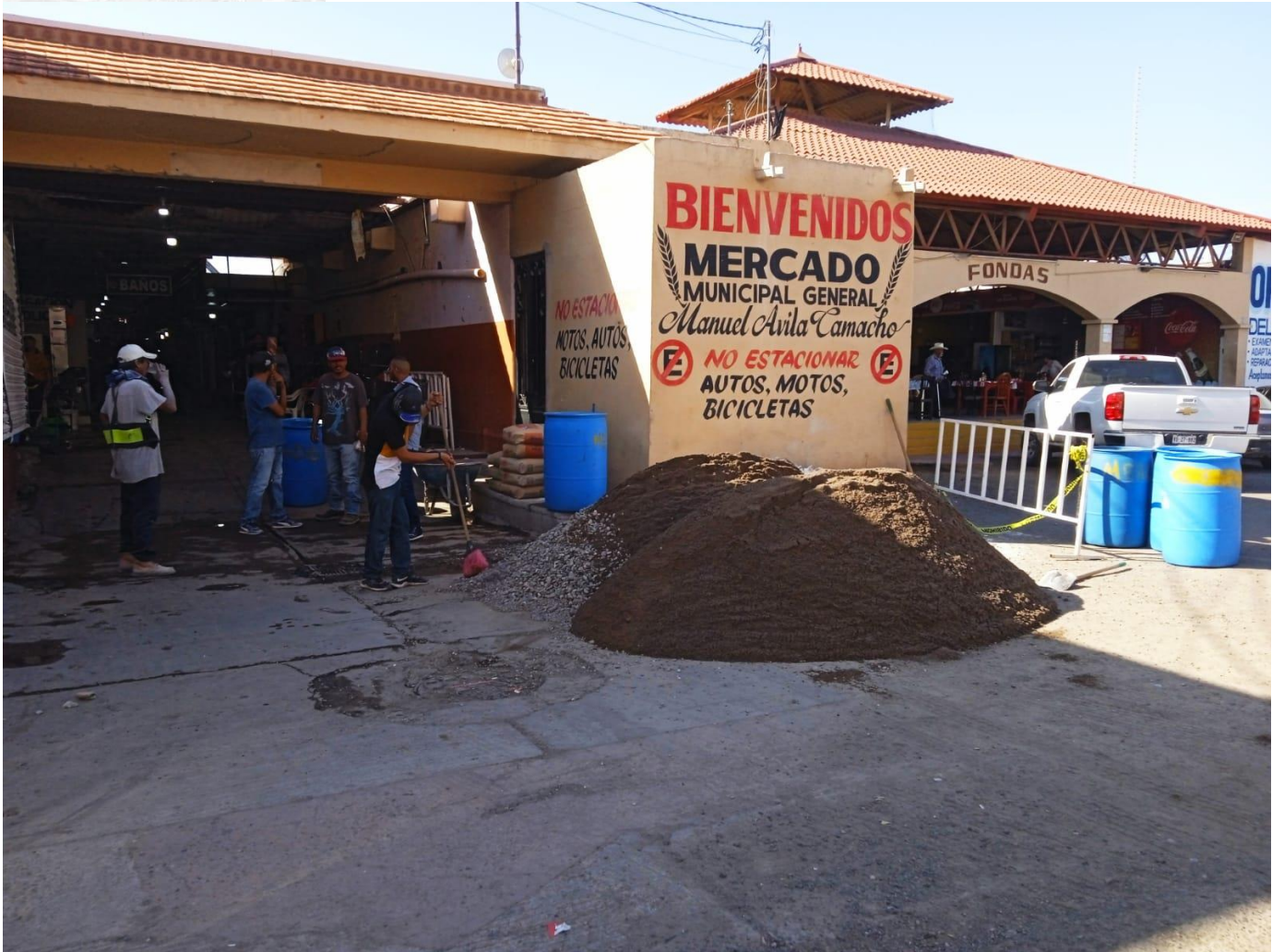
Listo el material en el mercado municipal