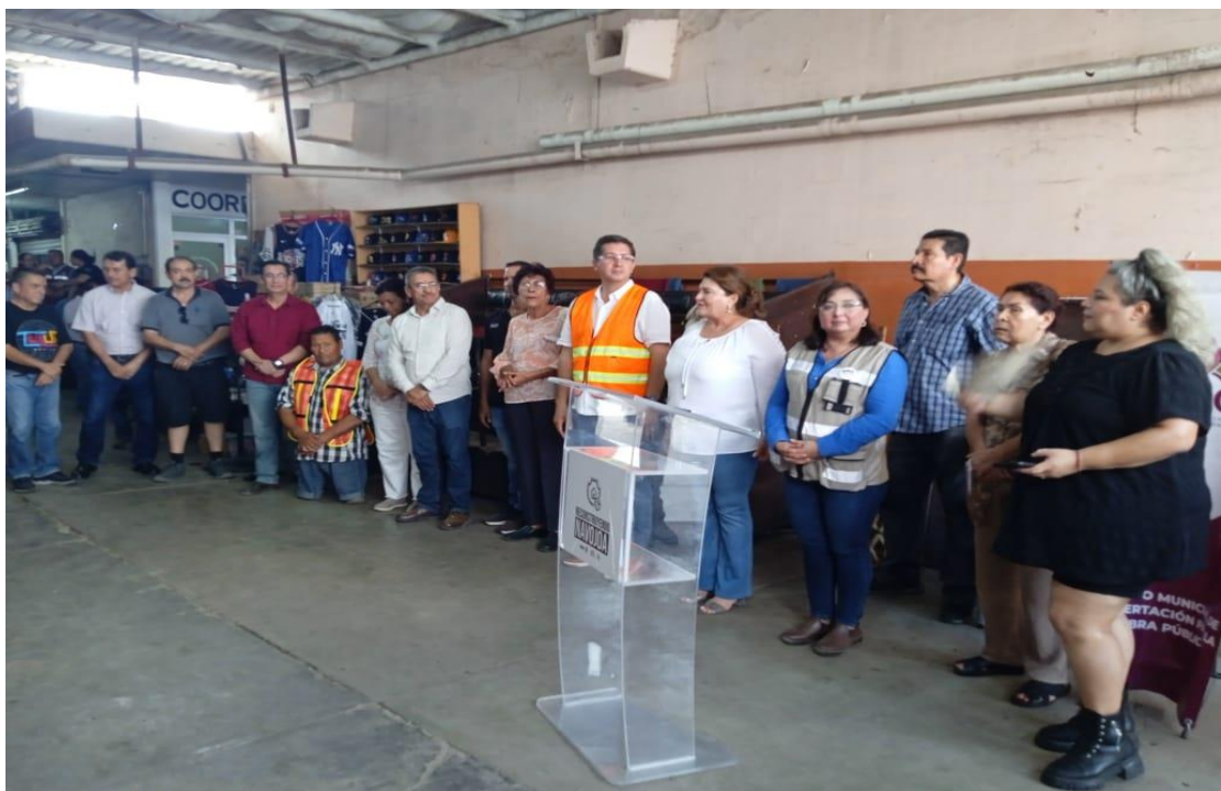
20/09/23 Banderazo de remodelación de los baños del mercado municipal