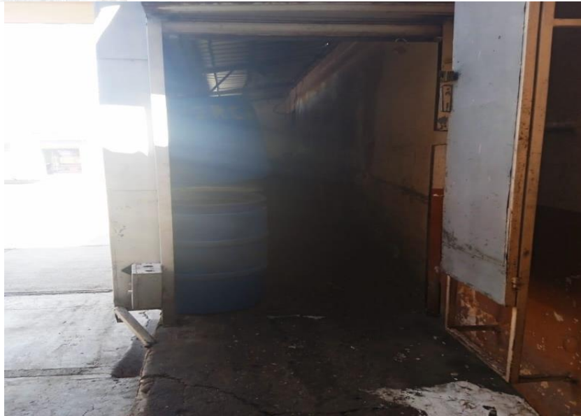
Contenedor de basura del mercado municipal orden - limpieza y alineamiento