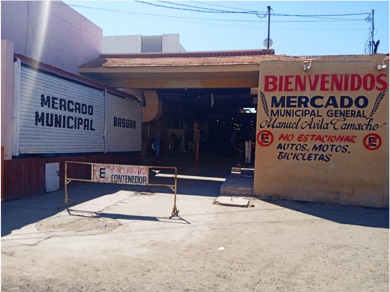
16 /09/23 contenedor de basura del mercado municipal área exterior limpieza y labado