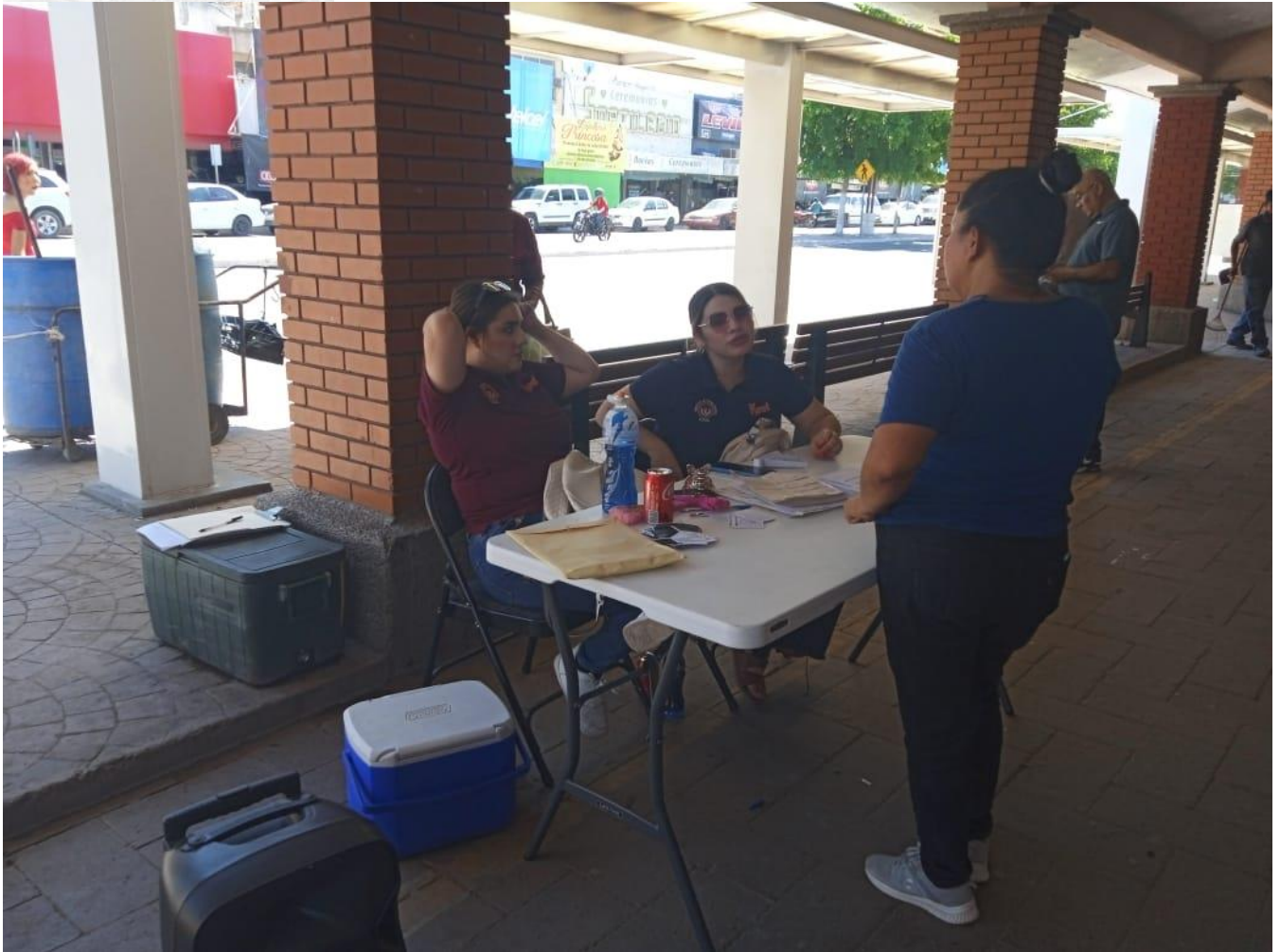
05-14 y 15 de septiembre 2023 instalación de un módulo en el mercado municipal para recibir solicitudes de empleo. CANACINTRA valle del mayo.