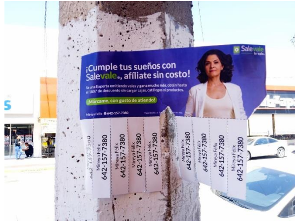
21 ,22 ,26 y 29 de septiembre de 2023 publicidad que se quito