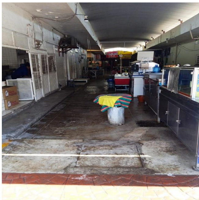
18/09/23 Limpieza ,orden y alineamiento pasaje Colima