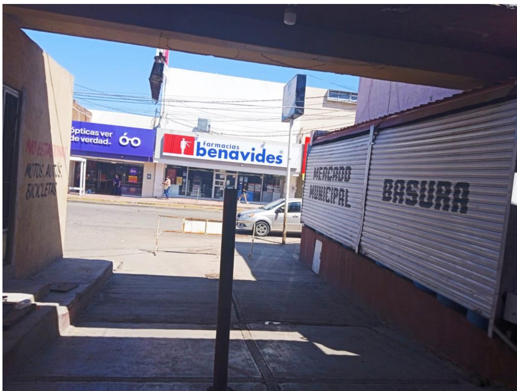
Contenedor de basura del mercado municipal área exterior - área interior limpieza y labado de pisos