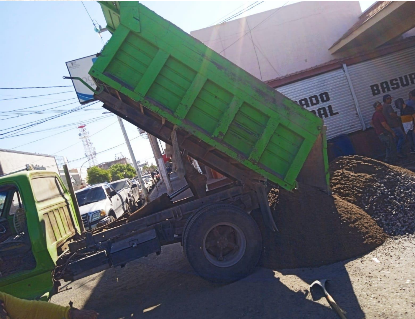
Material para la remodelación del mercado municipal 26/09/23