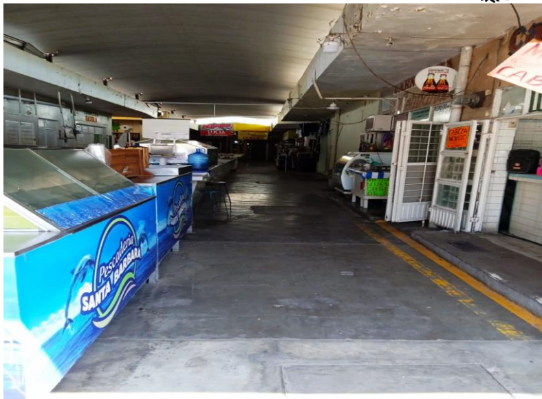
Área exterior del mercado municipal pasaje colima marchantas carnicería y pescadería , limpieza ,orden y alineamiento